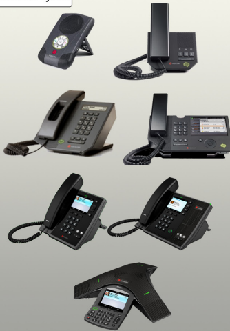
Serie Polycom CX