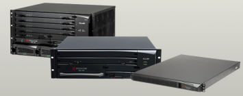
Serie Polycom RMX®