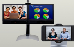
Serie Polycom HDX®