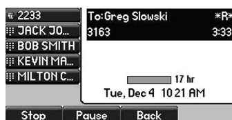
A tutte le registrazioni viene automaticamente applicato un contrassegno di data e ora che semplifica l'archiviazione e la riproduzione

Questa applicazione consente agli utenti di registrare qualunque conversazione localmente sul telefono SoundPoint IP 650, tramite un'unità USB esterna standard. Tutte le chiamate vengono registrate con la massima qualità audio, per garantire una riproduzione assolutamente perfetta. Questa funzione è utile soprattutto nel settore legale e finanziario, in cui può essere necessario registrare le chiamate per soddisfare speciali requisiti di legge o di tenuta delle scritture contabili